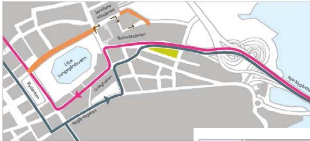
Omlagging buss i sentrum (jan. 08 - sept. 09)